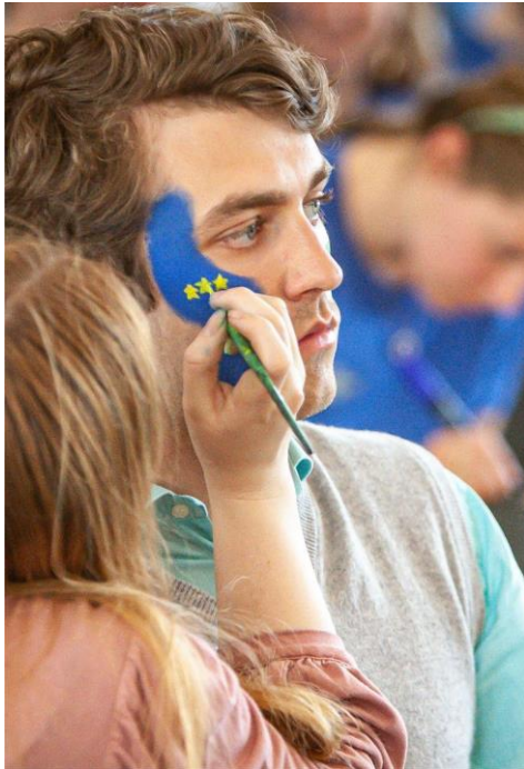
Kit de communication