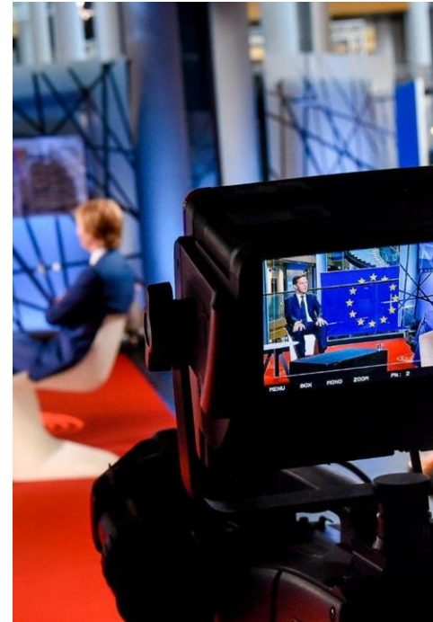
Vidéos de personnalités