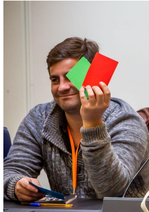
Kit d' actions