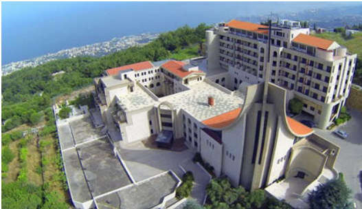
Notre Dame du Mont

Du Lundi 26 au jeudi 29 octobre 2020 dans un cadre magnifique à Notre Dame du Mont (Adma Fatka) près de Jounieh au Liban.