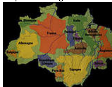
Pays européens de la zone amazonienne

respiratoires principalement chez les enfants et les personnes âgées.