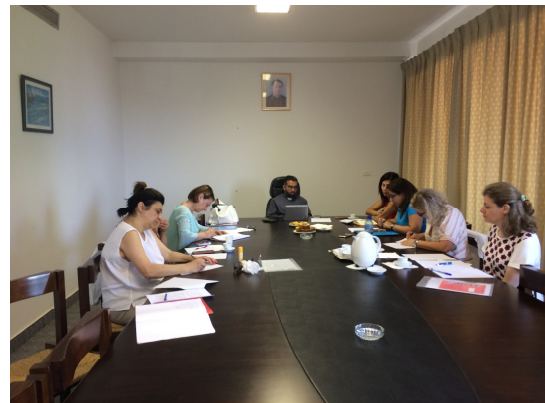
Equipe du Liban qui nous accueillera.